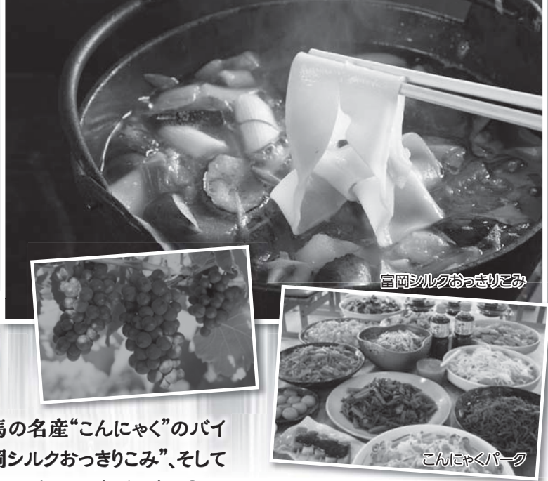
富岡シルクおっきりこみ

全国のこんにゃく芋の生産量の9割を占める群馬の名産“こんにゃく”のバイキングに、たちばな源氏庵でしか食べられない“富岡シルクおっきりこみ”、そして“下仁田ネギ”と群馬グルメで食欲の秋を満喫してみたいはいかがでしょうか？