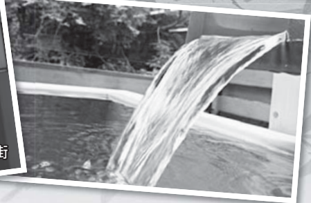
※画像はイメージです。