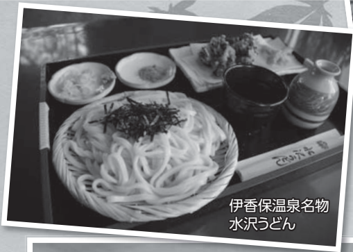
伊香保温泉名物 水沢うどん