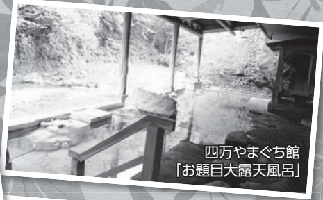
四万やまぐち館 「お題目大露天風呂」