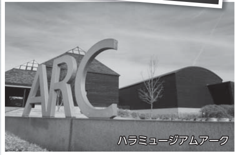
ハラミュージアムアーク