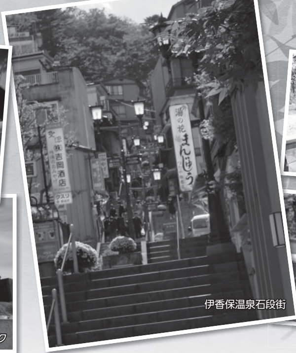
伊香保温泉石段街