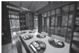
食事処「ふじざくら」