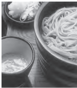
◀和気あいあいのそば打ち体験