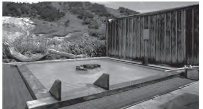
▲上信越高原に臨む標高1,800mの万座温泉