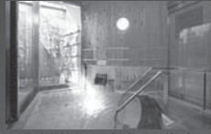
▲身障者対応風呂(家族風呂兼用)「あおほ」(要予約)