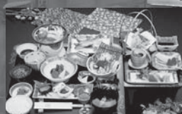
▲和食内容は季節により異なります。(要予約)

※ 利用人数に含まれるのは3歳以上の方となります。 ※ 小人料金は、上記料金及び通常料金のいずれか低い方の料金となります。 ※ 4階は全客室禁煙となります。「喫煙」「禁煙」のご希望がございましたら、ご予約の際にお申し出ください。