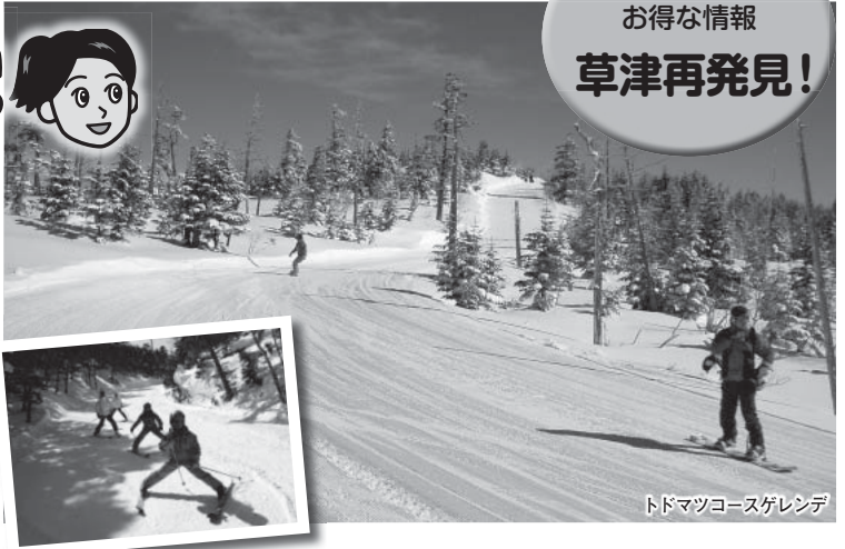
トドマツコースゲレンデ

標高2,000mを超える白根山を有する草津。冬 の一番の人気スポットといえば「草津国際スキー 場」です。スキー・スノーボードの上級者はもち ろん、お子さま連れのファミリーまでみんなが楽 しめる白銀の世界で、豪快に滑り、雪と戯れて、 楽しいウィンターバケーションを体験してみませ んか。