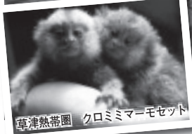
草津熱帯園 クロミミマーモセット